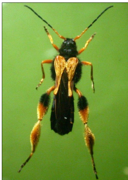
■ FIGURA 6. MACHO ADULTO DE Callisphyris macropus , CHILLÁN, VIII REGIÓN, NOVIEMBRE.

han detectado cortes producidos por esta especie en ramas de hasta alrededor de 9 cm (ver Figuras 5 y 9). Estos cortes causan una marchitez apical del follaje durante la brotación y desarrollo posterior de la planta, un síntoma característico de la