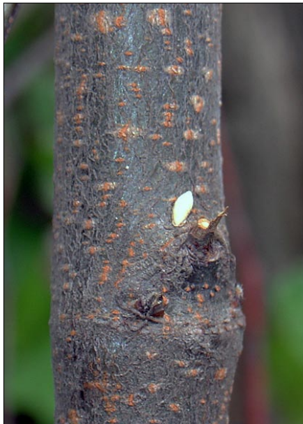
■ FIGURA 2. OVIPOSTURA DE Callisphyris apicicornis EN CORTEZA DE MEMBRILLERO, NOVIEMBRE, REGIÓN METROPOLITANA.