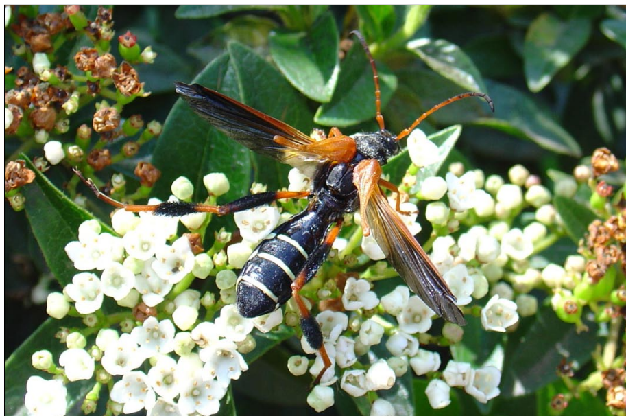
■ FIGURA 1. HEMBRA ADULTA DE Callisphyrus apicicornis VISITANDO FLORES, OCTUBRE, REGIÓN METROPOLITANA.

mayor tamaño, abdomen más grande y antenas más cortas que los machos. Los huevos (Figura 2) son blanquecinos, de ~ 3 mm de largo, con corion muy resistente, ovoides, con los extremos aguzados. La larva es típicamente cerambiciforme (Figura 3), amarilla, de hasta 45 mm en el último estadio. La pupa (Figura 4) es de color amarillo claro.