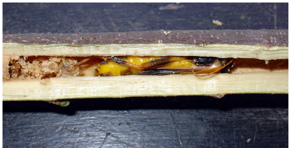
■ FIGURA 7. ADULTO NEONATO DE Callisphyris apicicornis EN RAMA DE TAMARIX, REGIÓN METROPOLITANA, OCTUBRE.