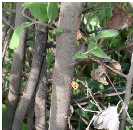
■ FIGURA 11. PERFORACIONES CAUSADAS POR LARVA DE Callisphyris apicicornis EN RAMA DE MEMBRILLERO, CON AGLOMERADOS DE ASERRÍN EXPULSADOS HACIA EL EXTERIOR, REGIÓN METROPOLITANA, SEPTIEMBRE.

para su manejo, tal como lo informa recientemente la literatura especializada para otras especies de Cerambycidae, utilizando trampas con atrayentes potentes, en particular feromonas sexuales (Reddy, 2007). Para desarrollar estas estrategias se requiere primero estudiar el comportamiento natural asociado a estos compuestos. Preliminarmente se ha demostrado que las hembras son atractivas para machos, incluso cuando no son visibles, y que ellos responden con conductas propias de insectos atraídos por feromonas sexuales. Los estudios básicos en esta materia se han comenzado en 2007 en el Depto. de Sanidad Vegetal de la Facultad de Ciencias Agronómicas de la Universidad de Chile. Luego se procederá a capturar compuestos con trampas de