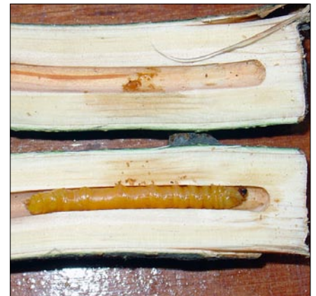
■ FIGURA 12. LARVA DE ÚLTIMO ESTADÍO DE Callisphyris apicicornis EN EL FINAL DE LA GALERÍA CAVADA (FRENTE DE AVANCE) EN UNA RAMA DE MEMBRILLERO, REGIÓN METROPOLITANA, OCTUBRE. LA LARVA FUE ELIMINADA CON LA RAMA PODADA.

para su manejo, tal como lo informa recientemente la literatura especializada para otras especies de Cerambycidae, utilizando trampas con atrayentes potentes, en particular feromonas sexuales (Reddy, 2007). Para desarrollar estas estrategias se requiere primero estudiar el comportamiento natural asociado a estos compuestos. Preliminarmente se ha demostrado que las hembras son atractivas para machos, incluso cuando no son visibles, y que ellos responden con conductas propias de insectos atraídos por feromonas sexuales. Los estudios básicos en esta materia se han comenzado en 2007 en el Depto. de Sanidad Vegetal de la Facultad de Ciencias Agronómicas de la Universidad de Chile. Luego se procederá a capturar compuestos con trampas de