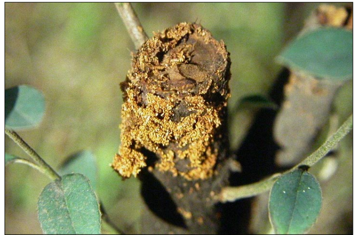
■ FIGURA 10. CORTE CAUSADO POR LARVA DE Callisphyris apicicornis EN RAMA PRINCIPAL DE COTONEASTER, REGIÓN METROPOLITANA, SEPTIEMBRE.