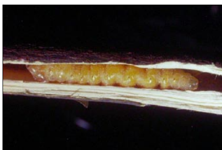
■ FIGURA 3. LARVA DE ÚLTIMO ESTADIO DE Callisphyris apicicornis EN EL INTERIOR RAMA DE MEMBRILLERO, REGIÓN METROPOLITANA, SEPTIEMBRE.

Los adultos tienen hábito diurno y son excelente voladores. En la zona centro sur se observan entre noviembre y fines de enero (Artigas 1994), aunque la emergencia de adultos en la zona central se inicia en octubre. La evidencia actual sugiere que el encuentro de ambos sexos está mediado por feromonas producidas por la hembra. Luego de la cópula (Figura 5), las hembras depositan sus huevos sobre la superficie de la corteza [similar a lo escrito por Carrillo et al. (1996) para el caso de Callisphyris macropus , Figura 6], donde quedan adheridos. Durante la eclosión, la