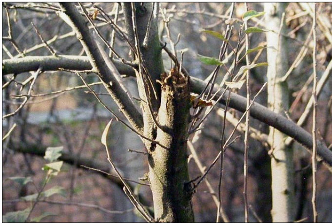
■ FIGURA 9. CORTE CAUSADO POR LARVA DE Callisphyris apicicornis EN RAMA DE MANZANO DE ALREDEDOR DE 6 CM DE DIÁMETRO, REGIÓN METROPOLITANA.