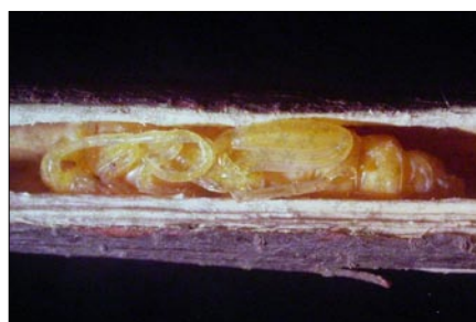
■ FIGURA 4. PUPA DE Callisphyris apicicornis EN EL INTERIOR RAMA DE MEMBRILLERO (ES EL MISMO INDIVIDUO DE LA FIG. 3, PERO FOTOGRAFIADO CASI UN MES DESPUÉS), REGIÓN METROPOLITANA, OCTUBRE.