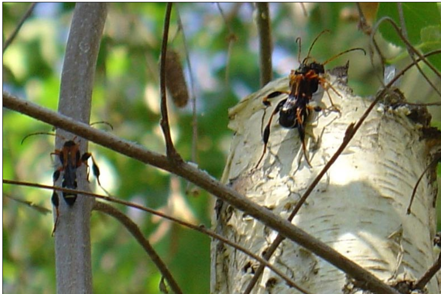
■ FIGURA 5. PAREJA DE Callisphyris apicicornis EN CÓPULA (DERECHA) EN TRONCO DE ABEDUL, REGIÓN METROPOLITANA, OCTUBRE. EL MACHO (DE MENOR TAMAÑO) SE ENCUENTRA SOBRE LA HEMBRA (MÁS GRANDE). UN SEGUNDO MACHO SE ACERCA EN UNA RAMA PARALELA (IZQUIERDA), PARA RIVALIZAR CON EL PRIMERO. SE OBSERVA ADEMÁS EL CORTE DEL EJE DEL ÁRBOL DE ALREDEDOR DE 9 CM DE DIÁMETRO, HECHO PREVIAMENTE POR UNA LARVA DE LA SIERRA DEL MANZANO.

han detectado cortes producidos por esta especie en ramas de hasta alrededor de 9 cm (ver Figuras 5 y 9). Estos cortes causan una marchitez apical del follaje durante la brotación y desarrollo posterior de la planta, un síntoma característico de la